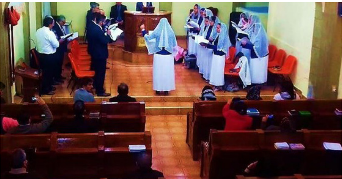
Fig. 1. “Mujer dirige coro local”. Enero, 2019. Comunidad de “El Buen Pastor” en Ciudad Labor, Tultitlán, Estado de México.